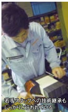
若手スタッフへの技術継承もしっかりと行われている

現在は新規事業として、変圧器のレンタル事業に進出。今後は太陽光発電をはじめとする環境対応型エネルギー分野への積極的な展開もめざす。変圧器は、2兆円マーケット。社員自らが考え、行動し、一丸となって、同社はさまざまな可能性に挑み続ける。