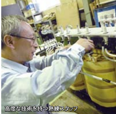
高度な技術を持つ熟練スタッフ