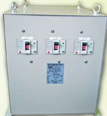
特殊変圧器にオーダーメイドで対応し、製造実績は3万件を超える