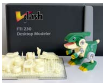
最新鋭の3Dプリンターを駆使し『ネジザウルス』キャラクターやポスターも社内で製作

そして誕生したのが、頭が潰れたネジを外す工具『ネジザウルス』。製品が無数に並ぶ店頭では、商品の良さを伝えるのには困難を極める。そこでネジにかぶりついで回すイメージから『ネジザウルス』というインパクトのある名前を採用。デザインにも遊び心を注入し、先端が口、NSというマークが目、と恐竜が口を開けて笑っているように見える意匠にこだわった。さらに漫画家にキャラクターデザインを依頼し、一家に一本を合い言葉に国民的アイテムの座を狙う。