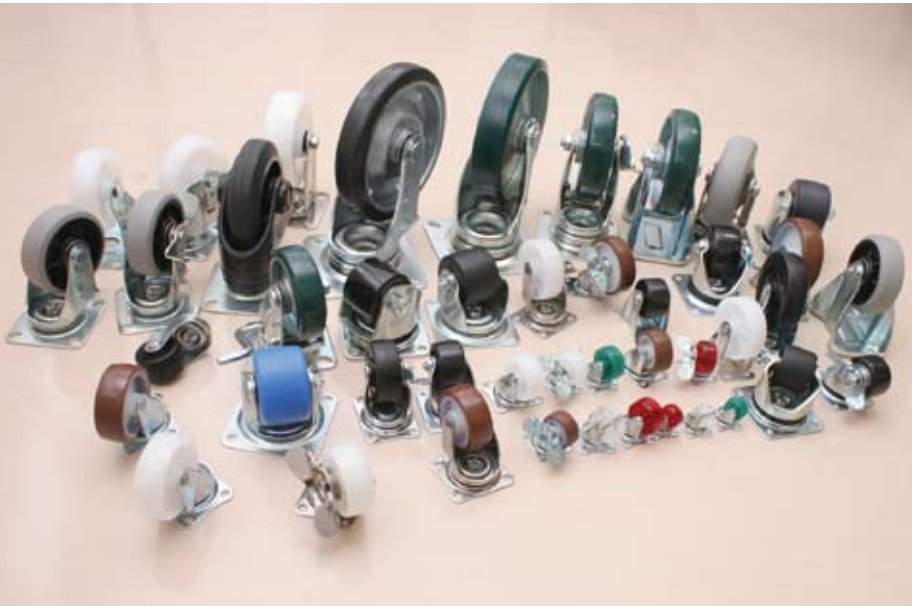
ユーエイキャスターの多彩なキャスター群。6,000点以上のラインナップを誇る