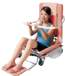
お風呂を充分に楽しめる『ビーチア DX』入浴者が安心して湯につかれる多数の工夫がある

同社では高い技術力を前提として、より明確に他社と差別化するため、5年サイクルで最新鋭の機械に入れ替え、設備を充実させている。特に溶接技術に関しては、関西ではまだ数社しか取り入れていないというYAGレーザー溶接機をいち早く導入。薄板溶接や難易度の高い平面度を要する溶接は、他社の追従を許さない程の完成度だ。一般的なTIG溶接と比べ、鏡面仕上げをする際に研磨工程を短縮できたり、溶接のひずみやそり