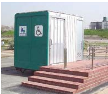
同社が開発した環境対応型移動式トイレ「ムーブレット」。全国の市町村に納入されている

「製造業は国内だけを考えていてはいけない」と、常に危機感を持っている石河社長。今後は東南アジア諸国等、海外への進出も視野に入れ、さらなる発展をめざす。