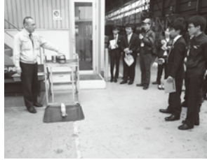
実際に金型を落として安全について説明