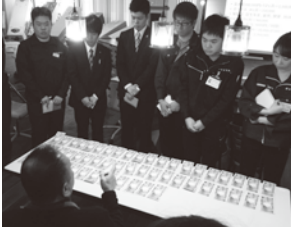
給与について実際の現金を並べて説明

このMOBIO-cafeについては、大阪ケイオスがやっている新入社員研修のひとつである「ひとづくり」にスポットをあて、平成28年度新入社員研修の最終プログラムとして、その実践を研修報告会という形で行うものです。