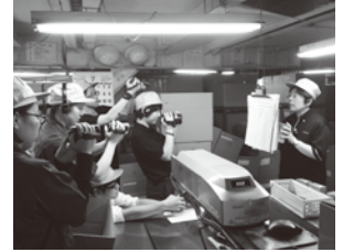
プロモーション映像の撮影・編集実践 (MOBIO展示場にて上映中)