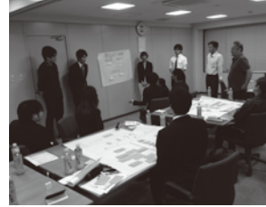
未来の社会についてディスカッション