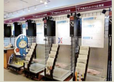
同センターも協力した“門真市ものづくり企業展”の展示コーナー。(MOBIO内)