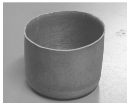
ロールキャスト AM61 板の深絞り

本方法は、プレス成形用マグネシウム合金板の安価な作製方法です。従来、硬くて薄板の作製が困難であったAM60やAZ91の薄板の作製が可能で、また、設備が小さいことも特徴です。技術開発の段階ですがアルミニウム合金を含めると2,000回以上の鋳造実験を行い、最適鋳造条件を把握しています。10台以上のロールキャスターを自作し、安価に作製するためのノウハウの蓄積もあります。