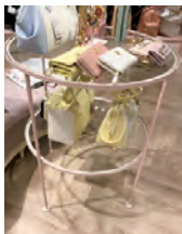
高級ブランド店舗の仕器