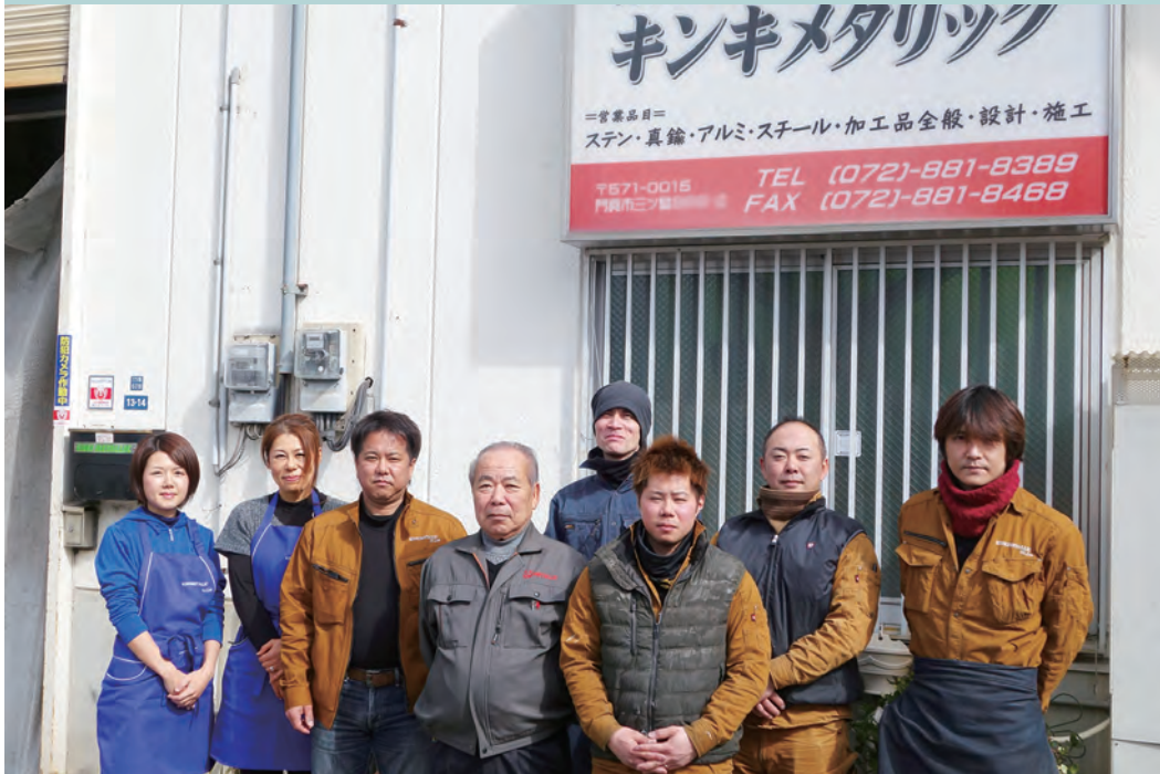
質の高い金物製品を支える社員たち