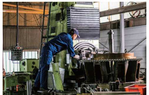
大型製品の加工が可能な歯切盤