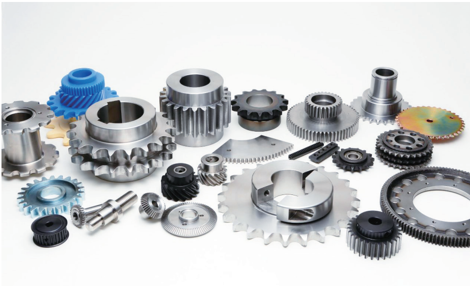
スプロケット、ギヤなど各種齒車製品