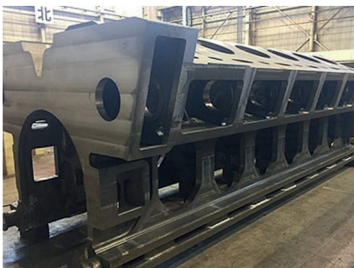
株式会社木村鋳造所