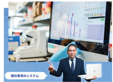
株式会社 大阪オフィス・オートメーション