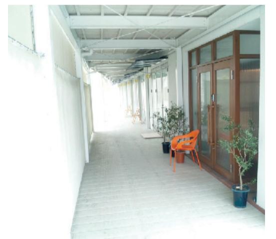
顧客からの要望で2013年に誕生したLABO。研究室実験から機械設計まで幅広く対応する