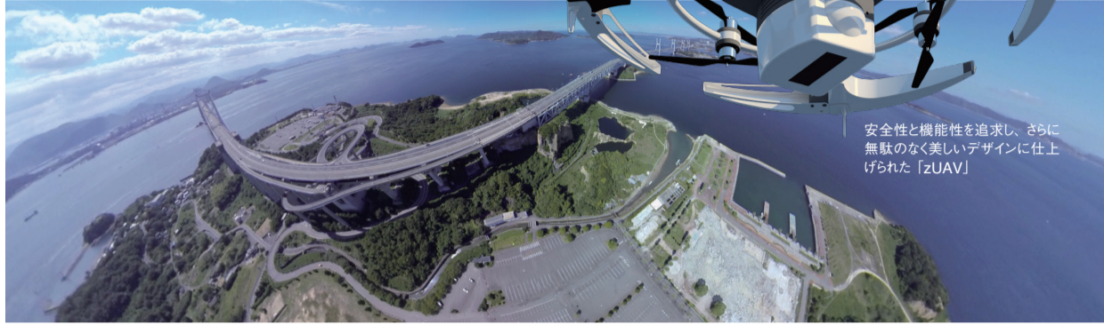
ドローンによって撮影された、360度全周映像コンテンツ

同社では国内で安全に使うことを第一に考え、オリジナル機体の開発を続け、災害地などの過酷な環境下での計測を繰り返した。昨年おこなわれた国交省の「次世代社会インフラ用ロボット開発・導入に向けた現場検証」では、オールAの最高評価を得た。その技術を導入し、第一線で活躍できる最新鋭の多目的ドローンとなる「zUAV」が5月に『第1回国際ドローン展』でお披露目された。