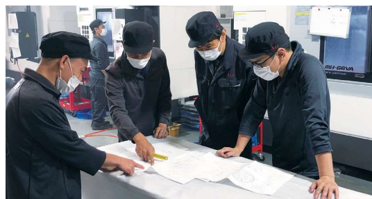
加工工程の確認風景