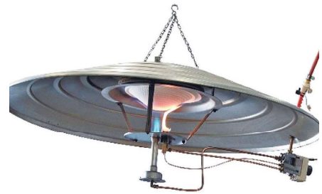
ジェットガスブルーダー