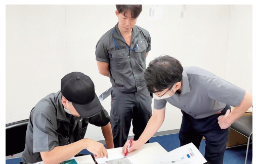
新たな商品開発の打ち合わせ風景