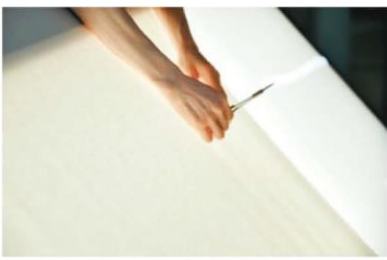
出荷時の品質には徹底的にこだわる

始めとした適切な製織技術を提案できる、課題解決型企業」であり続けたいですね」と阪上社長は話す。