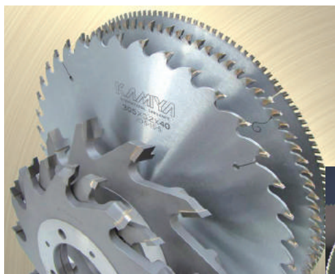
木質系材料加工用刃物