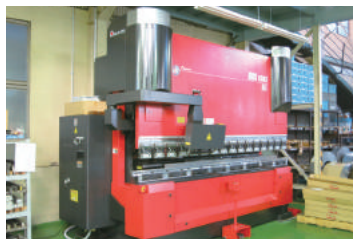
3mの材料まで対応できるベンディングマシンを導入

これから力を入れるのが、架台の受注拡大だ。技術を蓄積し、エアコン室外機や太陽光パネル以外の用途を開拓する。平成25年9月には専用金型の製作が不要なベンディングマシン（曲げ加工機）を新たに導入。多品種少量生産、短納期化、低コスト化に対応する。これまでは加工できる材料の長さが1.2mまでだったが、3mまで可能になった。今のところ海外展開は考えておらず、日本国内で勝負する方針。