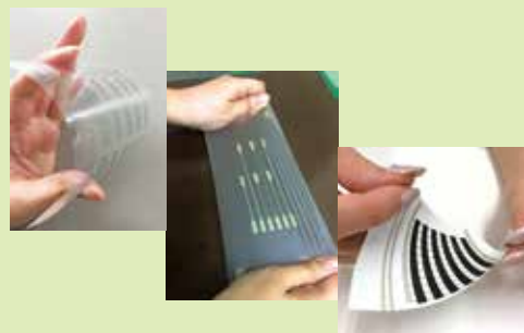
①ナノボンドα基板 ②ストレッチャブル基板 ③シートヒーター基板

株式会社 サトーセン 担当：要素技術 PT TEL : 06-6657-0777 Mail : sales@satosen.co.jp web : http://www.satosen.co.jp/