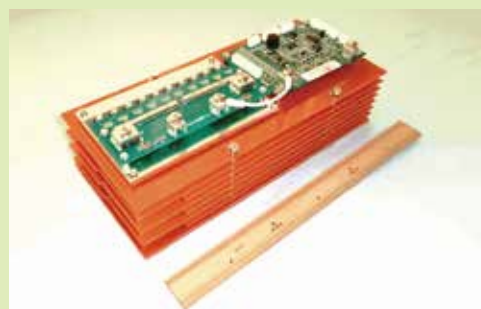
25V-15Ah のリチウムイオン電池モジュール

マイクロ・ピークル・ラボ株式会社 TEL : 06-6225-5398 Mail : matsuo@mvl.co.jp web : http://www.mvl.co.jp/