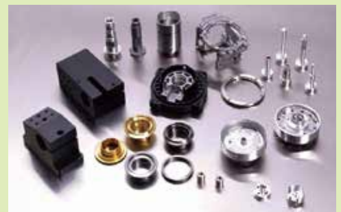
測定器・ビデオ・デジカメ・自動車等に用いられる部品

株式会社テンキング TEL : 06-6746-7566 Mail : info@tenking.co.jp web : http://www.tenking.co.jp