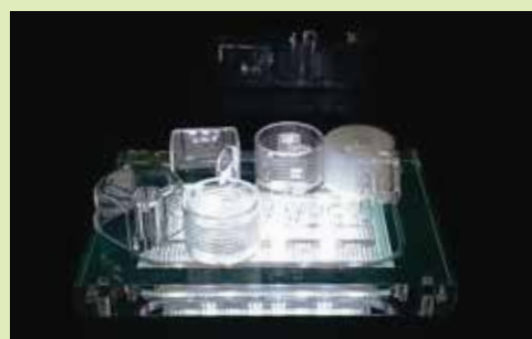
透明切削技術で貴社の開発に貢献します。

株式会社アリス 担当：開発ものづくり試作チーム TEL : 072-964-2100 Mail : info@arice-world0917.jp web : http://www.arice-world0917.jp